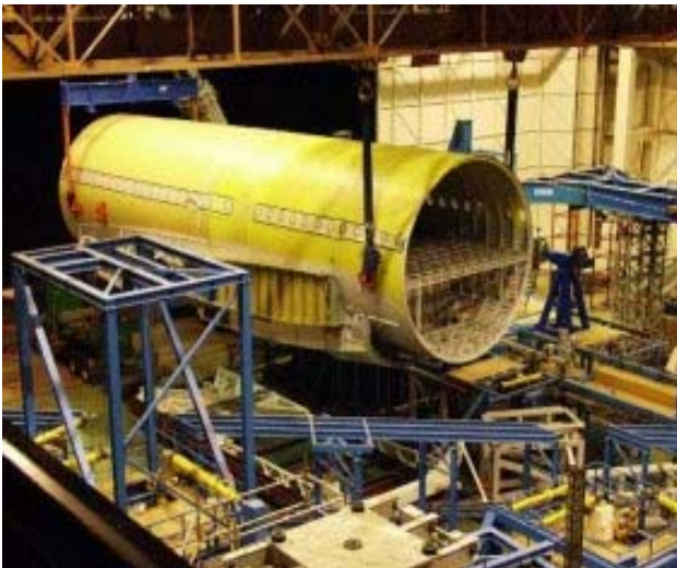
Abb.2: Gesamtzellenversuch: Installation des Prüflings in der IMA-Testhalle