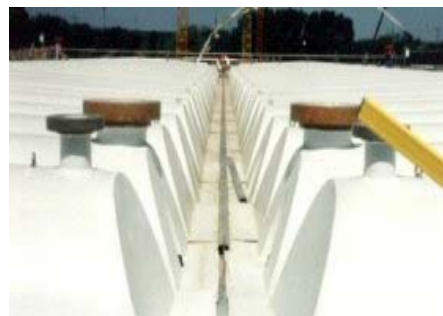
Abb.7: GFK-Abdeckungen für Kläranlagen

Entwicklung von Faserverbundkunststoff-Bauteilen