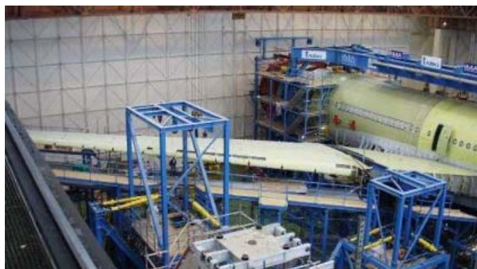
Abb.3: A340-600 Full Scale Fatigue Test