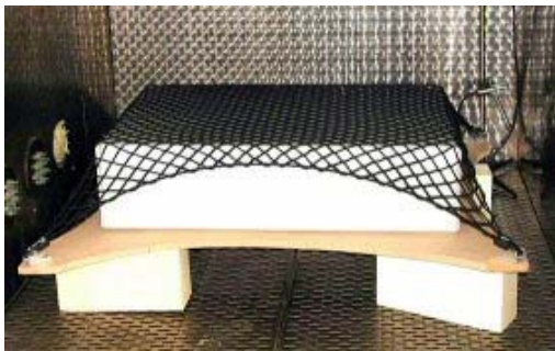
Abb.5: Klimaprüfung an einem Gepäcknetz