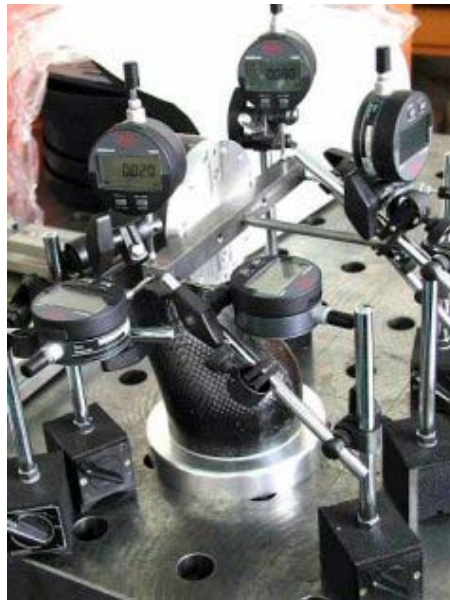
Abb.6: Steifigkeitsuntersuchung an einem Roboterarm