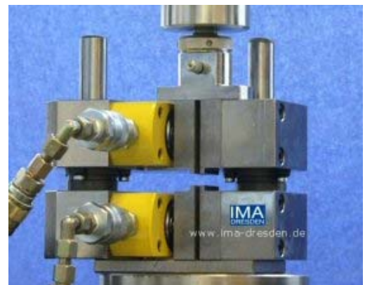
Abb.4: patentierte Druckprüfvorrichtung